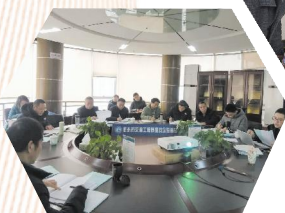
市交通运输局迎难而上,打破僵局瓶颈,全力以赴争取项目落地。

虽然拥有如此高的关注度,但江玉公路项目前期工作也并非一帆风顺。项目的基础设施江青线公路原属县道,等级低、路况差。而如果对江青线进行改造提升,又面临着投资大、占地多等问题。近几年又面临着上级对国道省道建设补助比例逐年下降、地方配套资金难以筹措解决等种种实际困难。但一直以来,市委市政府主要领导对加快推进江玉公路前期工作进度极为重视,不放任何一次有利于项目加快推进的机遇,市交通运输局更是迎难而上,坚持运输部门积极跑部进厅,打破僵局瓶颈,全力以赴争取。