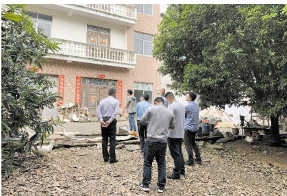
市交通运输局工作人员去农户家现场踏勘。

关山初度未忘,策马扬鞭再奋蹄。如今,随着土地组件报批的完成,项目已进入实质性实施阶段,我们有理由相信,这条大通道,一定会完成它“带动衢州乃至浙江省中西部内陆地区的发展,改善沿线地区交通状况,促进交通运输效率,打通沿线经济社会协调发展的致富之路”的历史使命;加快推进江山市域经济快速崛起,把江山打造成为浙西南毗邻地区最有影响力的城市,成为“浙江经济西进的桥头堡”。