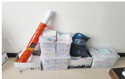
整理完成交接的工作材料

在征地过程中,相关部门单位始终坚持把工作着力点放在解决群众困难上,用服务提速来实现征迁加速。和乡镇(街道)一起,全程提供“保姆式”服务。