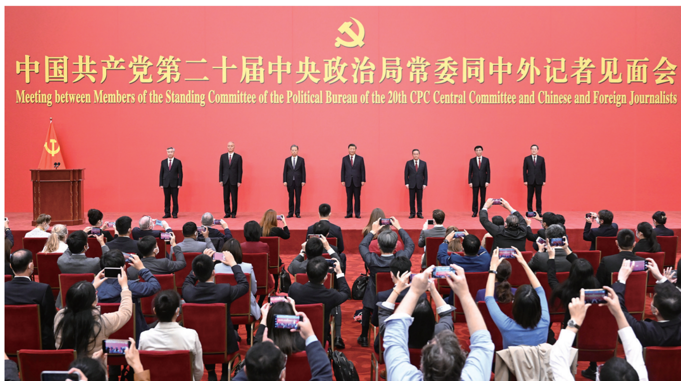
10月23日，刚刚在中国共产党第二十届中央委员会第一次全体会议上当选的中共中央总书记习近平和中共中央政治局常委李强、赵乐际、王沪宁、蔡奇、丁薛祥、李希在北京人民大会堂同采访中共二十大的中外记者亲切见面。

新华社北京10月23日电 中国共产党第二十届中央委员会第一次全体会议公报（2022年10月23日中国共产党第二十届中央委员会第一次全体会议通过）中国共产党第二十届中央委员会第一次全体会议，于2022年10月23日在北京举行。出席全会的有中央委员203人，候补中央委员168人。中央纪律检查委员会委员列席会议。习近平同志主持会议并在当选中共中央委员会总书记后作了重要讲话。全会选举了中央政治局委员、中央政治局常务委员会委员、中央委员会总书记；根据中央政治局常务委员会的提名，通过了中央书记处成员，决定了中央军事委员会组成人员；批准了二十届中央纪律检查委员会第一次全体会议选举产生的书记、副书记和常务委员会委员人选。名单如下：