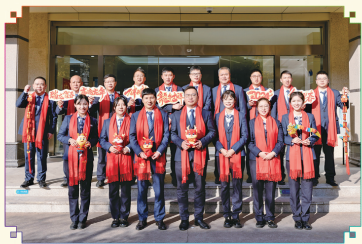
游头支行:祥龙相依,富佑相伴,喜乐平安,阖家团圆,事事顺心,福气满满,游头支行祝大家新年大吉!