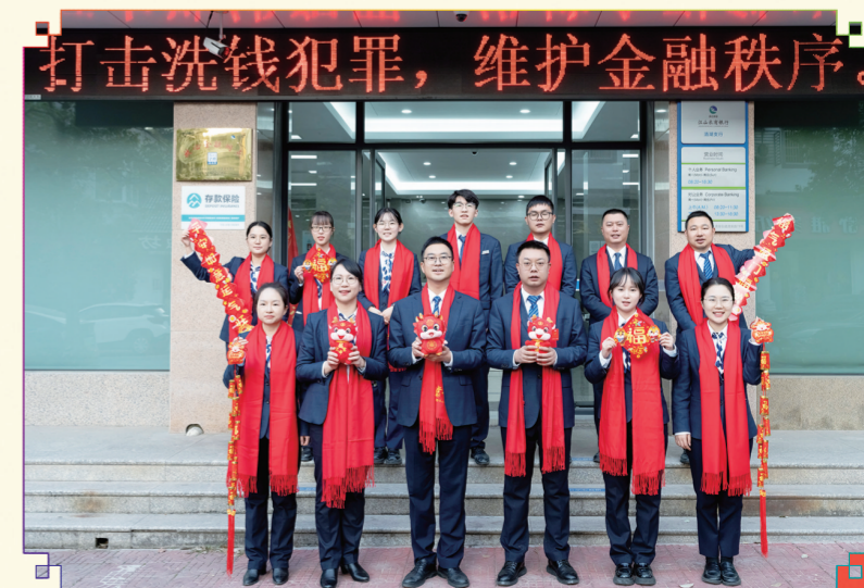
清湖支行:春风扫马千窗绿,福气刷屏万户红!清湖支行祝全市人民龙年龙行天下,大展宏图!新春快乐!