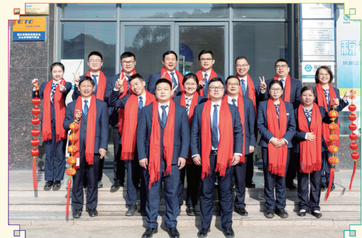
上余支行:律回春晖渐,万象始更新。上余支行祝全市人民龙腾虎跃展新颜,龙马精神体康安!