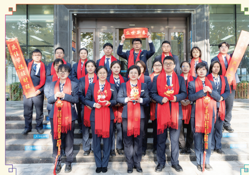
营业部:玉兔辞旧岁,金龙迎春来。江山农商银行营业部全体员工祝大家龙马精神,龙年大吉!