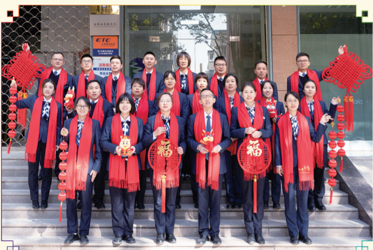
中山支行:腾龙起势,当红不让。龙气冲天,福运滚滚。新的一年,中山支行祝大家龙年展宏图,共创新辉煌!