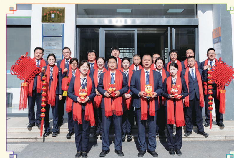
石门支行:龙年到,祝福到,石门支行恭祝大家新的一年,人健康,幸福长,事业兴,龙年财气旺旺!