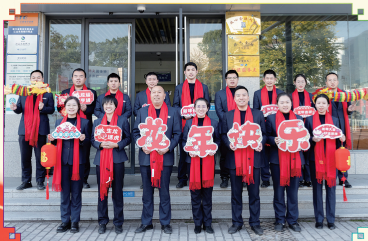
峡口支行:龙年新气象,祝福送万家。新的一年,峡口支行祝大家事业有成,家庭美满,福龙高照,好运长龙!