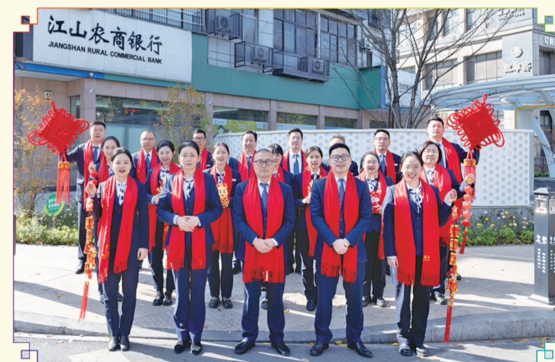
城关支行:瑞兔辞旧去,龙腾新年来。城关支行恭祝全市人民在新的一年里:龙飞凤舞,龙马精神,身体健康,阖家幸福!