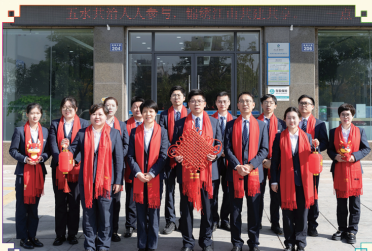
开发区绿色专营支行:龙年新气象,祝福送万家。江山农商银行开发区支行恭祝全市人民身体健康,万事如意,龙年腾飞,新春快乐!